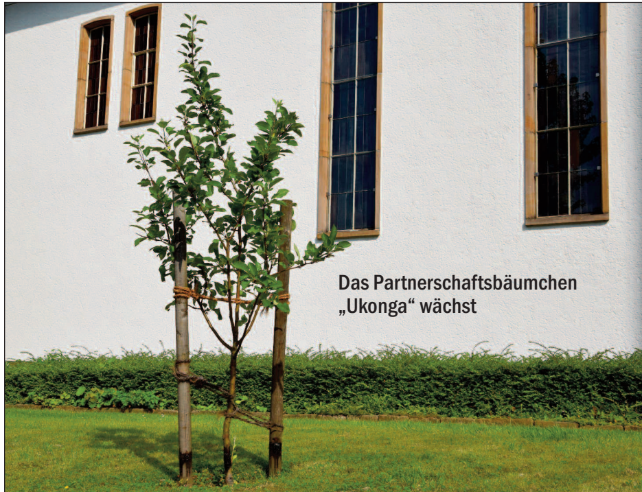
Das Partnerschaftsbäumchen „Ukonga“ wächst