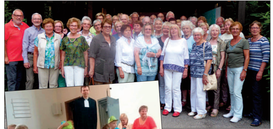
Studienreise Männerkreis, Miniclub, Gospelworkshop und Geburtstagsfest