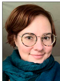
Angedacht von Pfarrerin Kristin Busch-Zimmermann

Sommerzeit ist Barfuß-Zeit. Sobald die Temperaturen draußen steigen, ignoriere ich meine Socken-Schublade. Denn es gibt nichts schöneres als nach der langen Zeit der kalten Temperaturen endlich wieder barfuß unterwegs zu sein. Im Haus die verschiedenen Böden unter den Füßen zu spüren: kalte Fliesen, Holzboden, flauschiger Teppich. Im Garten die frische Luft zwischen den Zehen, Terrassenplatten, feuchter Rasen am Morgen und trockenes warmes Gras am Abend. Der Sommer lädt dazu ein, den Dingen wieder neu nachzuspüren. Die Sonne an die Haut zu lassen, die Augen zu schließen, die Schuhe stehen zu lassen und mit den ungeübten empfindlichen Fußsohlen sich wieder neu zu spüren. Dieses Gefühl kannten auch die Psalmbeter in der Bibel.