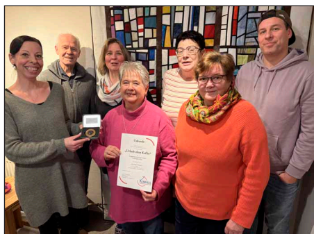
Das „Urlaub ohne Koffer“-Team freut sich sichtlich über den Preis und plant schon an der nächsten Ausgabe.

Die Stiftung Kompass hat dem „Urlaub ohne Koffer“ den goldenen Kompass für besonders gelungene kirchliche Arbeit verliehen. „Der Förderpreis Goldener Kompass 2025 wird an Projekte und Aktionen verliehen, die in besonderer Weise die Begegnung von Menschen fördern. Ins Ge-