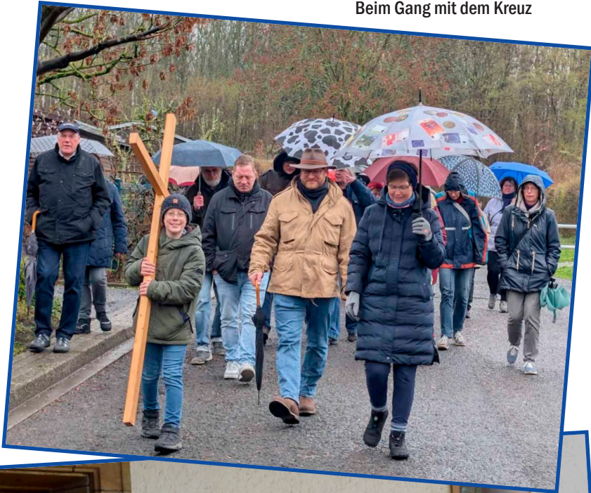
Beim Gang mit dem Kreuz